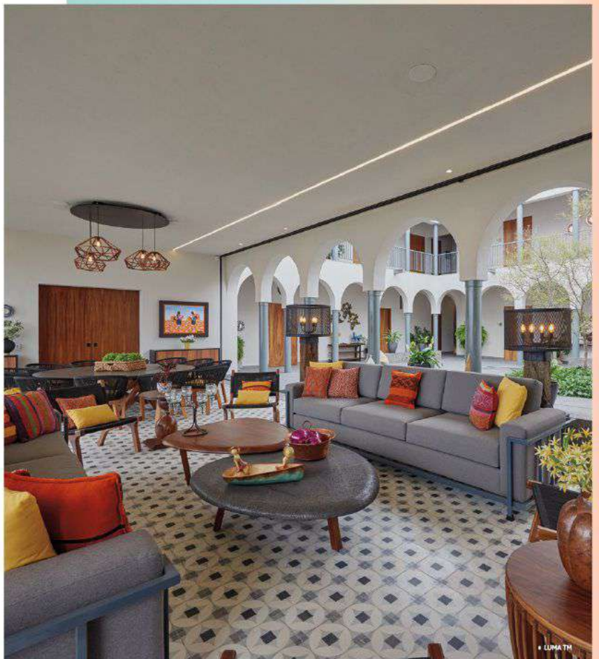
• LUMA TM