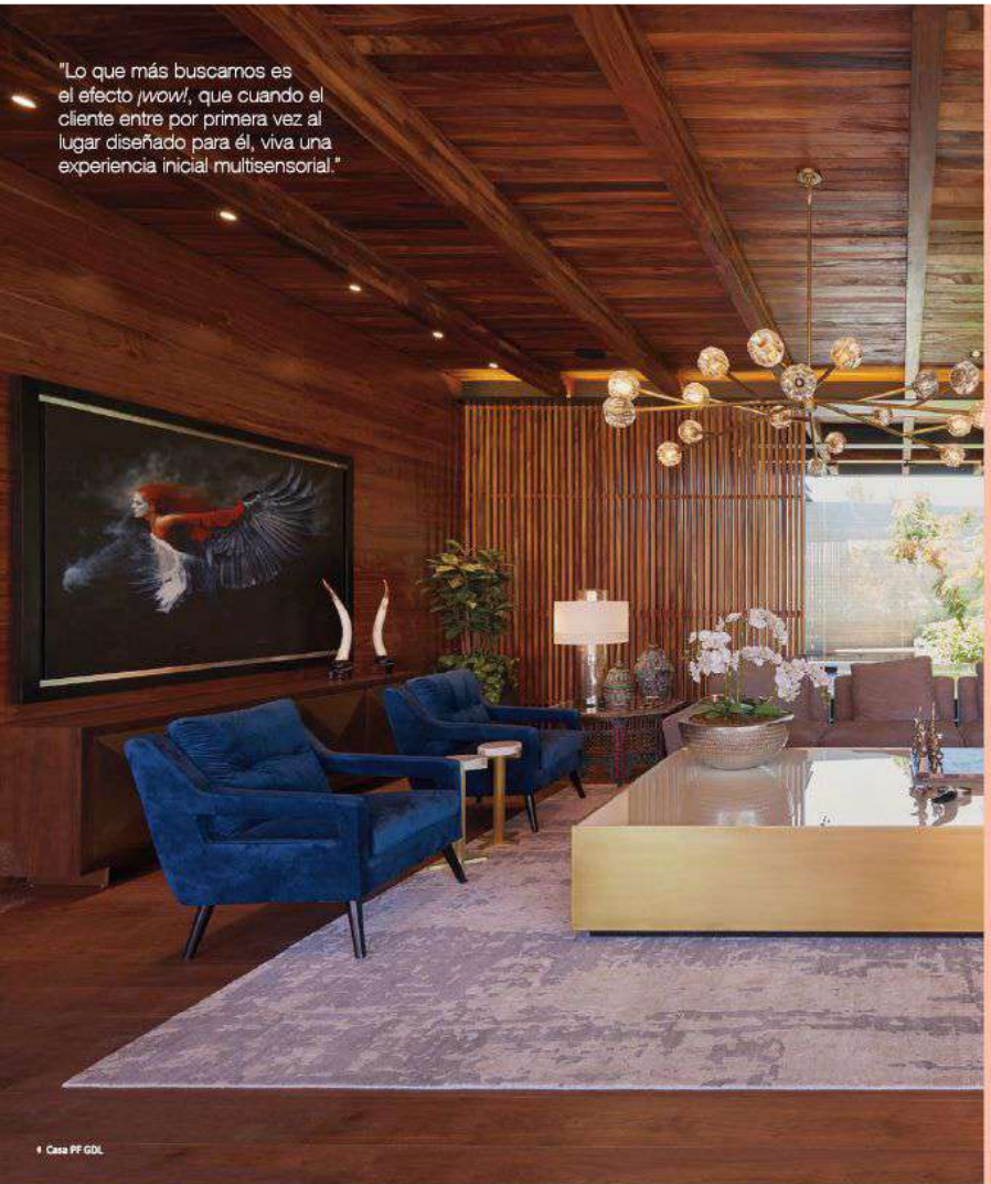
• Casa PF GDL

"Lo que más buscamos es el efecto wow! , que cuando el cliente entre por primera vez al lugar diseñado para él, viva una experiencia inicial multisensorial."