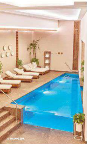
• HAIYAVE SPA

"Hay muchos clásicos que nunca pasan de moda, pero la silla Barcelona de Mies van der Rohe, ¡es mi favorita!"